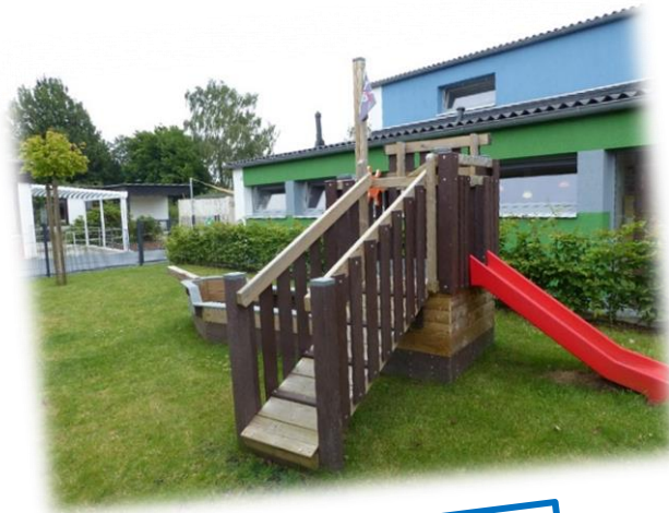
Piratenboot mit Rutsche

Auf dem Außengelände der Krippe bietet eine große Terrasse und ein gepflasterter Weg, der um die Krippe herumläuft, ausreichend Platz zum Fahren mit Bobby-Cars, Lauf- und Dreirädern. Zusätzlich zu einer großen Sandkiste gibt es zwei Schaukeln, ein Piratenboot mit Rutsche und einen Spielzeugschuppen.