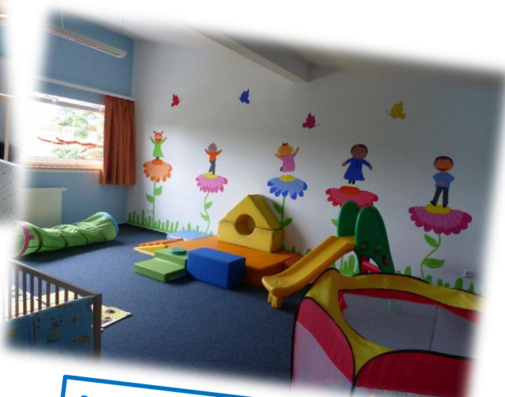
Bewegungs- und Schlafrum